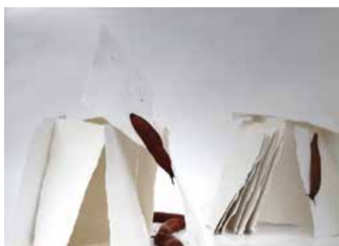
Knopp Ferro, TOLLHAUS, 1998, Videoinstallation, Farbfotoabzug