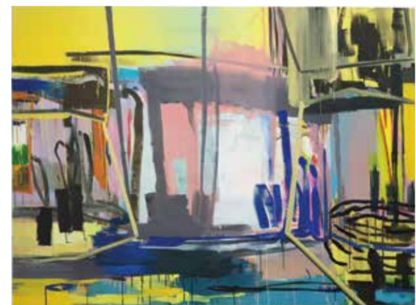
Elke Zauner, In the sky with diamonds, Acryl auf Leinwand, 140 x 190 cm, 2021, Foto: Elke Zauner

Führung mit Übersetzung in die Deutsche Gebärdensprache: 6.4., 18 Uhr