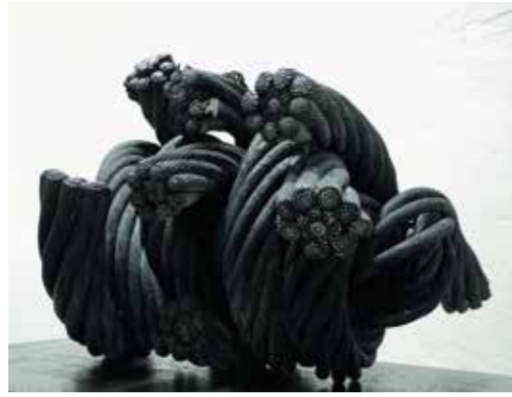
Till Augustin Die Kräfte der Umwälzung – 2021 3 Stahlseile geschmiedet, feuerverzinkt, patiniert, poliert Ca. 59 x 43,5 x 63,5 cm