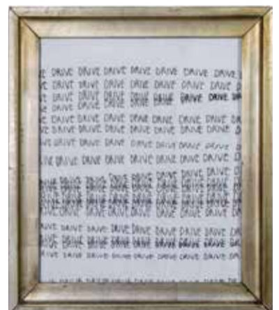
Pezi Novi, Drive, Textil in Rahmen, 38 x 22,5 cm, Foto: Max Lehmann