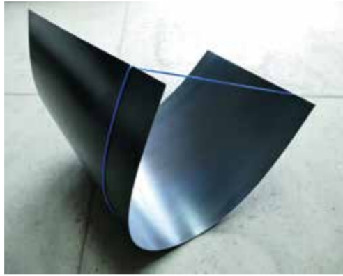
Gert Riel Spannungsfelder – 2020 Cortenstahl, Seilspannung Ca. 125 x 100 x 93 cm

Bitte beachten Sie die aktuellen Informationen auf unserer Homepage!